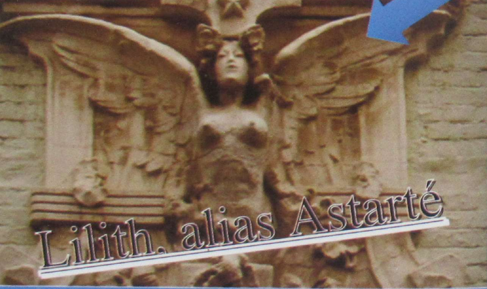
Lilith, alias Astarté

Ils abandonnèrent tous les commandements de l'Eternel, leur Dieu, ils se firent deux veaux en fonte, ils fabriquèrent des idoles d'Astarté, ils se prosternèrent devant toute l'armée des cieux, et ils servirent Baal. 2 Rois 17, versets 16-18